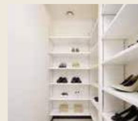
ナノイー付キャビンと姿見鏡