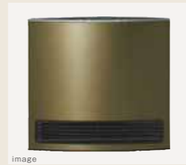
ガスファンヒーター