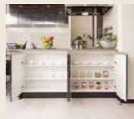
キッチンカウンター収納