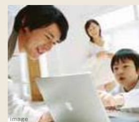
インターネット使い放題