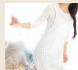
ゴミ回収サービス